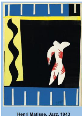
Henri Matisse. Jazz. 1943