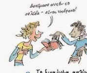
8 Το δικαίωμα απλώς να ξεφορτίσουμε ένα βιβλίο