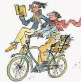
7 Το δικαίωμα να διαβάζουμε οπουδήποτε.