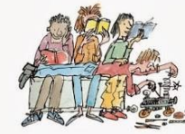
1 Το δικαίωμα να μη διαβάζουμε.